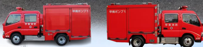
新 消防ポンプ自動車 (CD-1級) 車両諸元