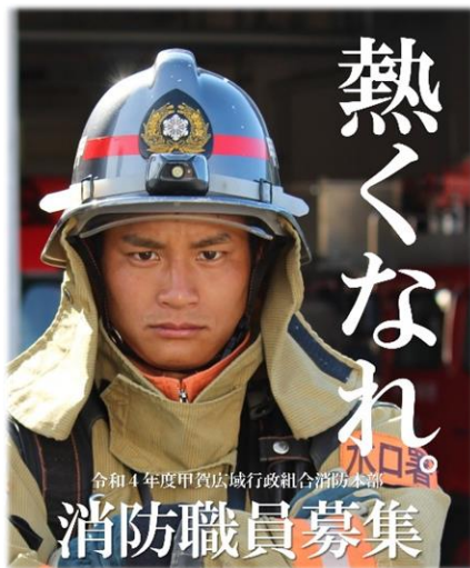
甲賀広域行政組合 消防本部